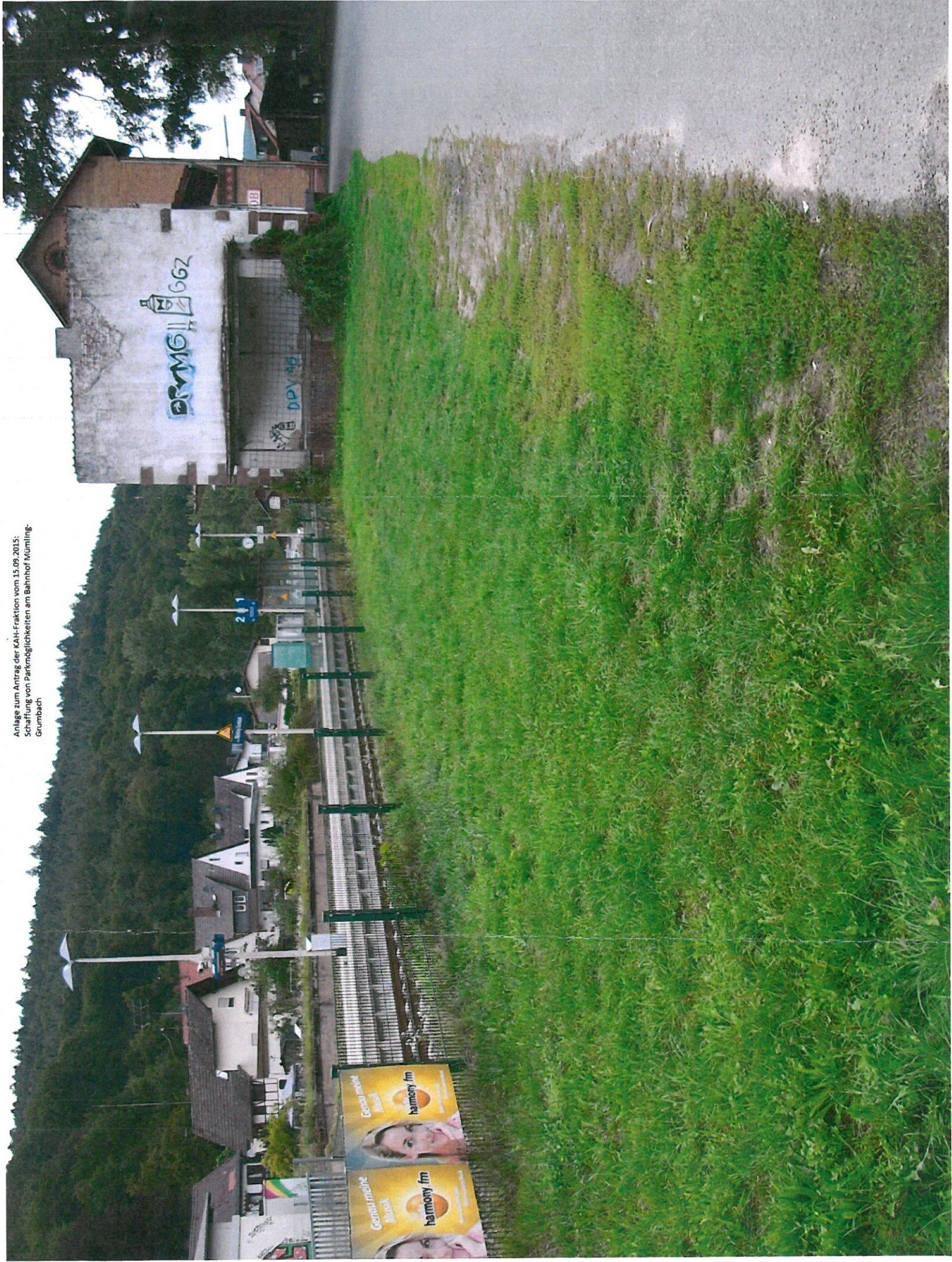
Anlage zum Antrag der KAH-Fraktion vom 15.09.2015: Schaffung von Parkmöglichkeiten am Bahnhof Mümpling- Grumbach